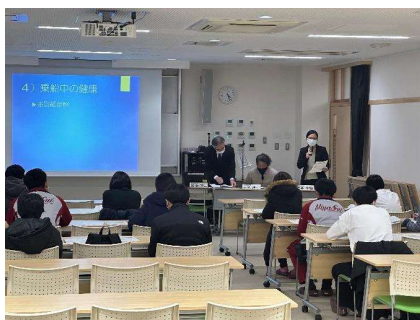
養護教諭より乗船までの健康管理説明