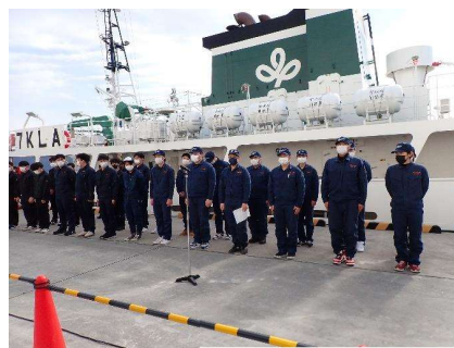
昨年度(令和6年1月)出港の様子！