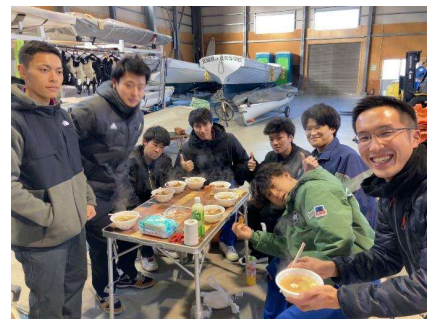
捕獲した『カニ』と『カニ汁をつくる様子とみんなで試食！』