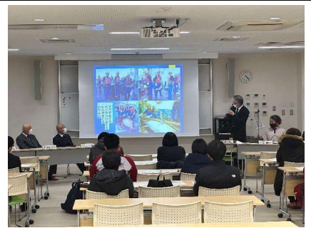
指導教官より航海実習の説明