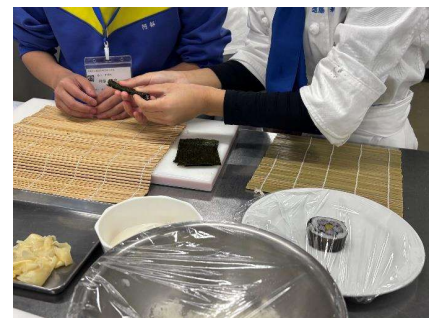
食品科(食産業類型(こめぼこ製造体験)・調理類型(飾り巻きづくり体験))

【学校説明会全体を通して印象に残ったことをお教えてください(良かった点、悪かった点、率直なご意見を願います)】