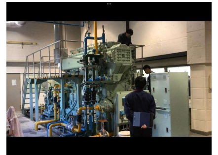
船舶運航科(学科説明・ロープワーク実習・エンジン見学)