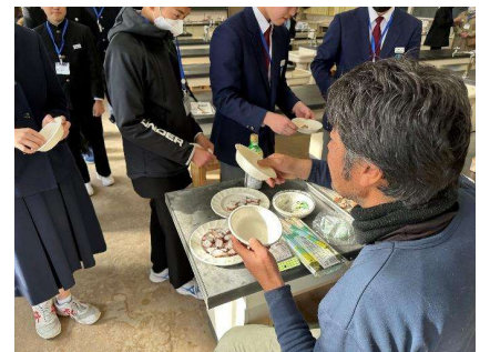
生物環境科(マダコをろう！マダコ解剖とタコ唐と刺身の試食)