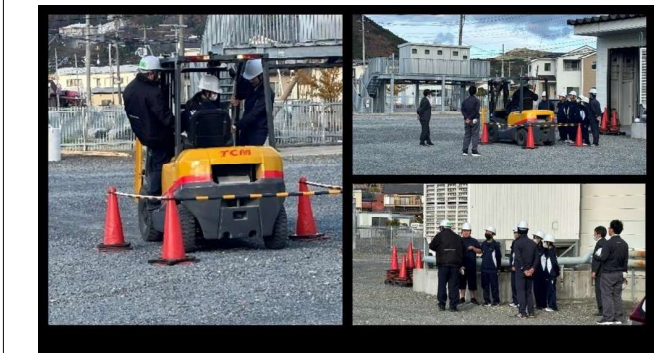
機関工学類型 『フォークリフト操縦』