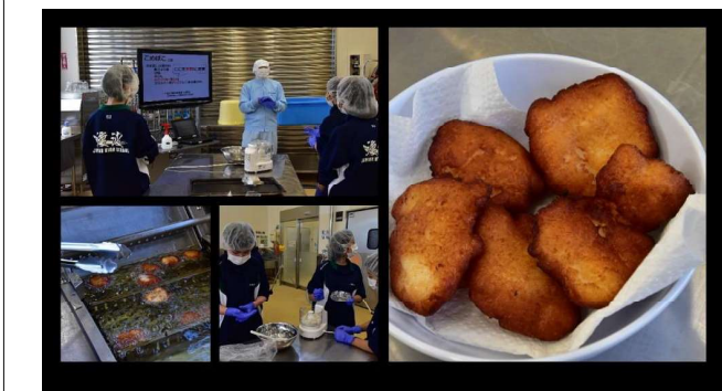
フードビジネス類型 『こめぼこ製造体験&試食』