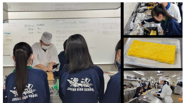
調理類型 『だし巻き卵づくり&試食』