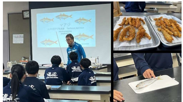
生物環境類型 『マアジについて学ぶ&アジフライ試食』