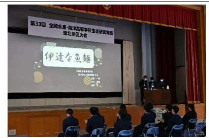
宮城県水産高等学校の発表