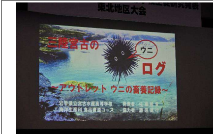
岩手県立宮古水産高等学校の発表