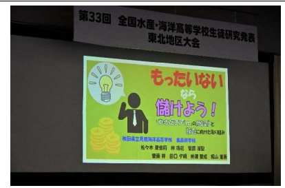
秋田県立鹿角海洋高等学校の発表