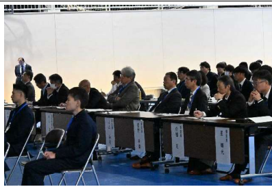
審査員の校長先生方