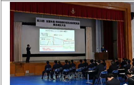
山形県立加茂水産高等学校の発表