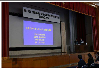
岩手県立久慈東高等学校の発表