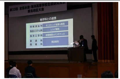
福島県立小名浜海星高等学校の発表