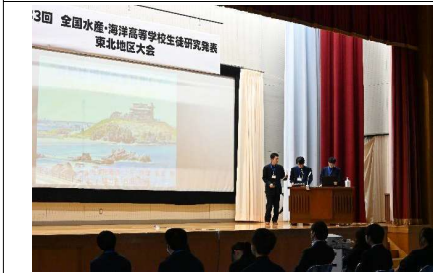
青森県立八戸水産高等学校の発表