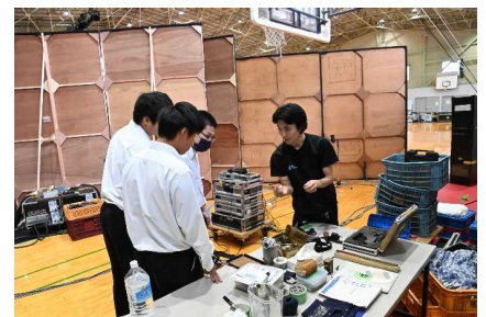
芸術鑑賞終了後、劇団の方々のご厚意でバックヤード・ツアーを行いました！