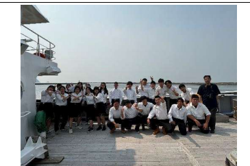
下船式の様子、みんな元気で無事に石巻に帰港しました！