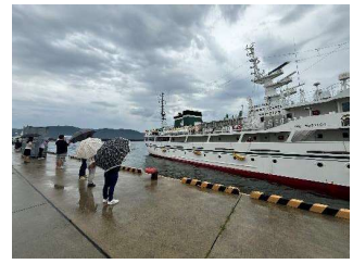
あいにくの雨で、船内（食堂）にて出港式を行いました！