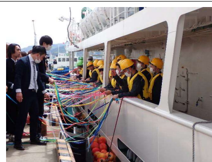
多くの人に見送られ出港です！