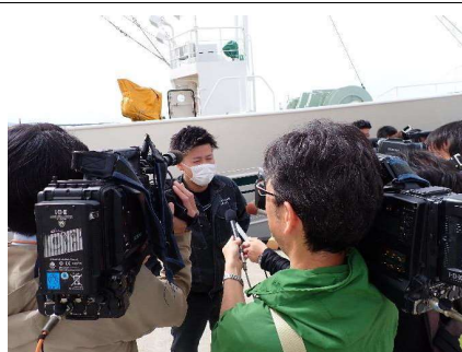
テレビの取材を受けました！